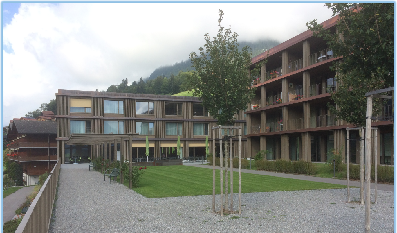
Bild einer Gesamtansicht des Gebäudes Lindenmatte, Erlenbach

(Projektvorstellung als Gesprächsgrundlage für Partnerärzte - Vertraulich)